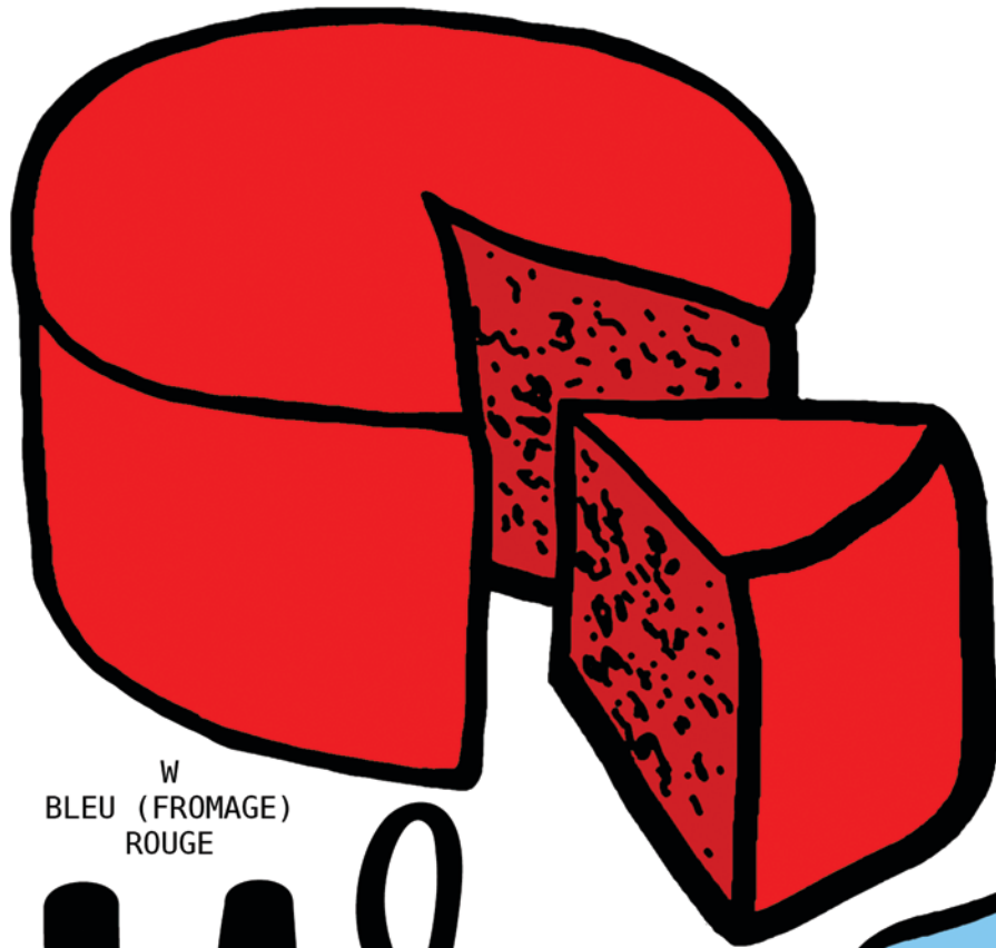
W BLEU (FROMAGE) ROUGE