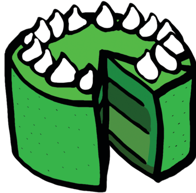
Y GATEAU VERT